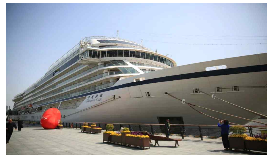
자료:上海航运(2023.3.26.), 邮轮“重后”, 上海邮轮母港首条国内沿海邮轮航线正式启动, https://mp.weixin.qq.com/s/PPQOtS6Cbl3uQhwlcPpC7w (검색일: 2023.3.30.)