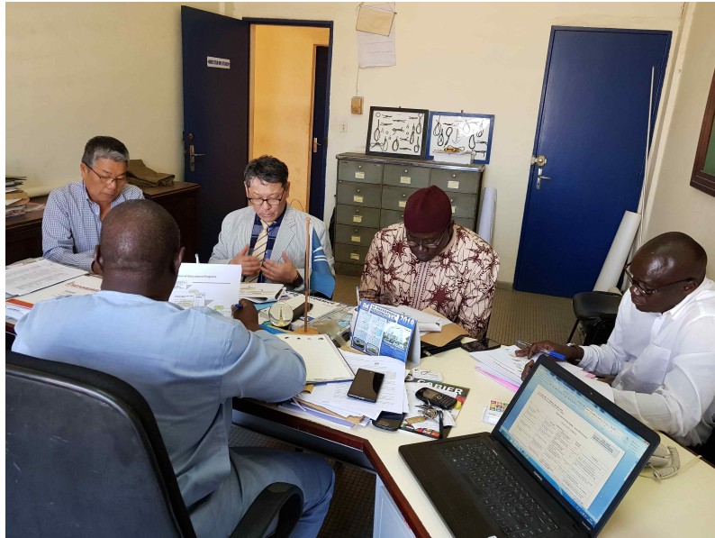
<ENFM 관계자들과의 최종보고회(2019.3.26)>