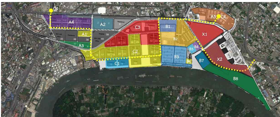
[ 방콕항 재개발 계획 ]