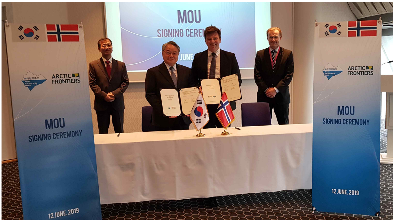
< KMI-북극프론티어사무국 MOU 체결 >