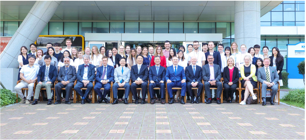
< 제5회 북극아카데미 개회식 단체사진 >