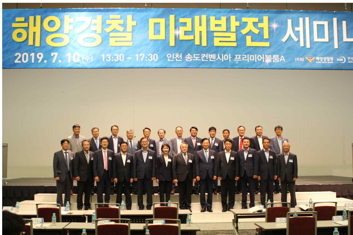
< 해양경찰 미래발전 세미나 >