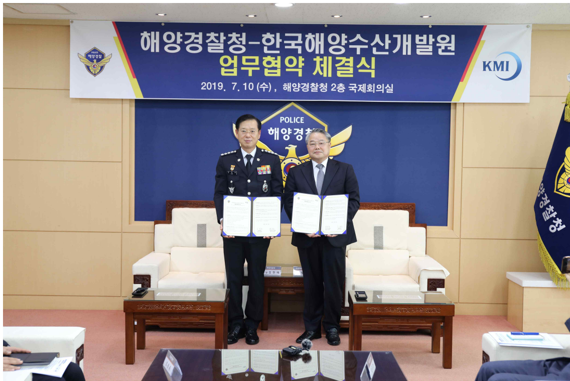
< 한국해양수산개발원(KMI) - 해양경찰청 MOU 체결 >