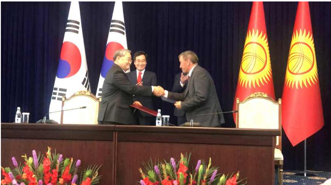
< KMI-키르기스공화국 농림수산물식품개량부 MOU 체결(2) >