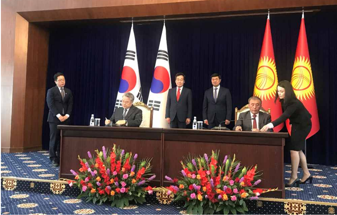
< KMI-키르기스공화국 농림수산물식품개량부 MOU 체결(1) >