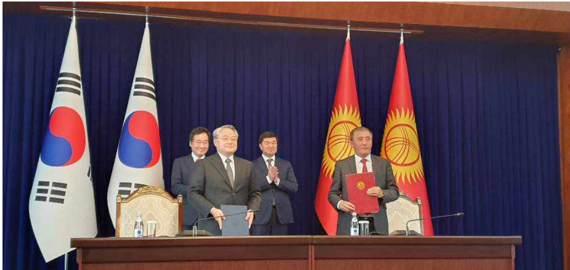
< KMI-키르기스공화국 농림수산물개량부 MOU 체결(3) >

※ 보도자료와 관련하여 자세한 내용이나 취재를 원하시면 해양수산ODA센터 전해은 연구원(051-797-4928, jhaeeun@kmi.re.kr)에게 연락주시기 바랍니다.