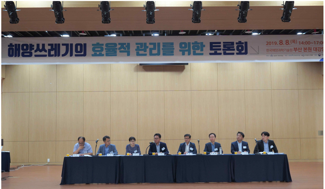
사진 설명 : 지명토론