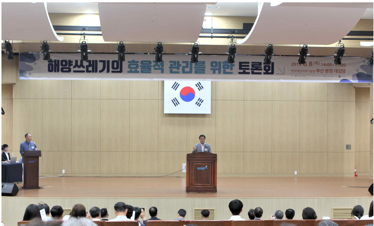
사진 설명 : 개회사 윤준호 국회의원