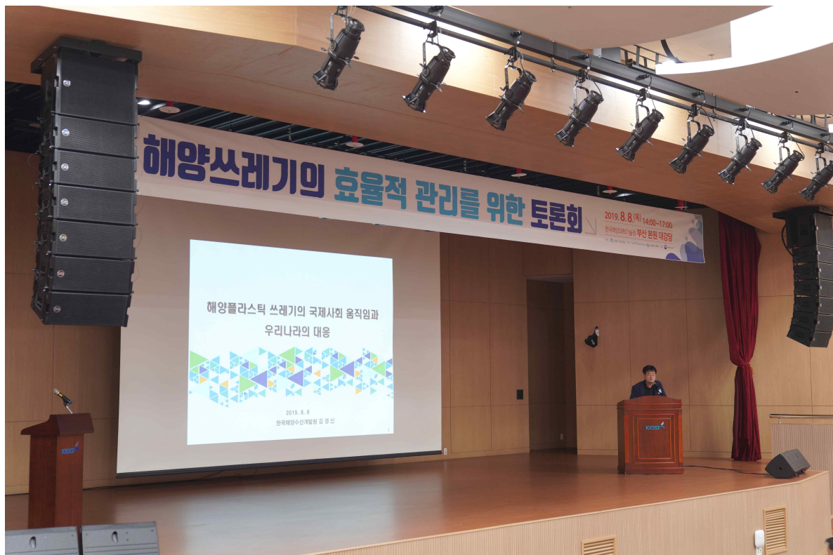
사진 설명 : 발표자 KMI 김경신