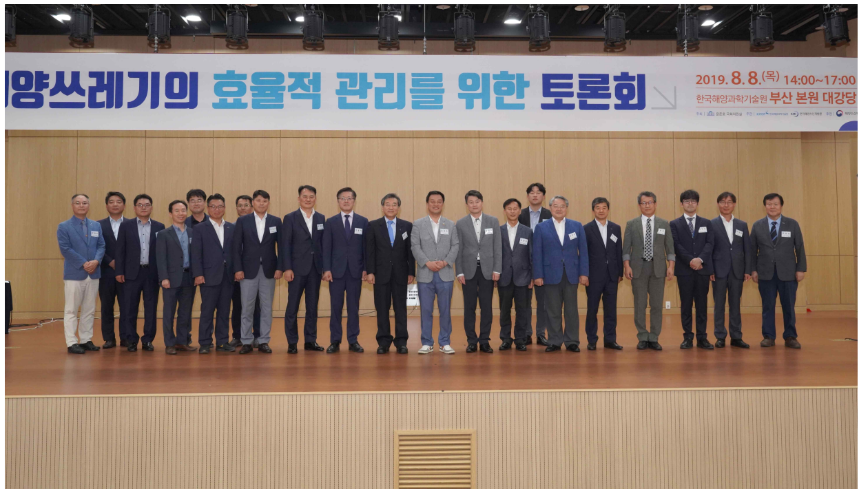
사진 설명 : 토론회 주요 참석자