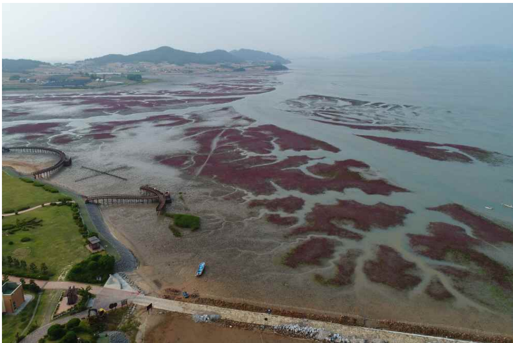
사진 설명 : 무안황토갯벌 칠면초

※ 보도자료와 관련하여 자세한 내용이나 취재를 원하시면 해양연구본부 해양공간연구센터 남정호 센터장(051-797-4712, jhnam@kmi.re.kr)에게 연락주시기 바랍니다.