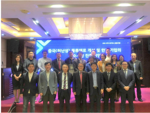
사진 설명 : 행사 참석자 단체사진