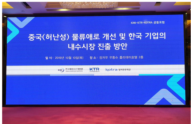
사진설명 : 행사개요