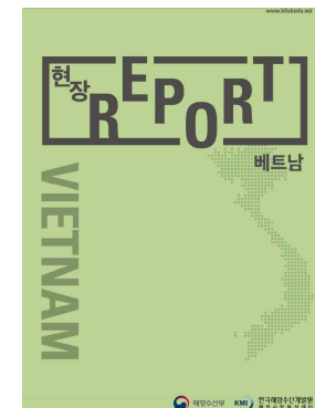
사진 설명 : 현장 리포트 베트남 표지

※ 보도자료와 관련하여 자세한 내용이나 취재를 원하시면 수산연구본부 해외시장분석센터 이다예 연구원(051-797-4907, daye@kmi.re.kr)에게 연락주시기 바랍니다.