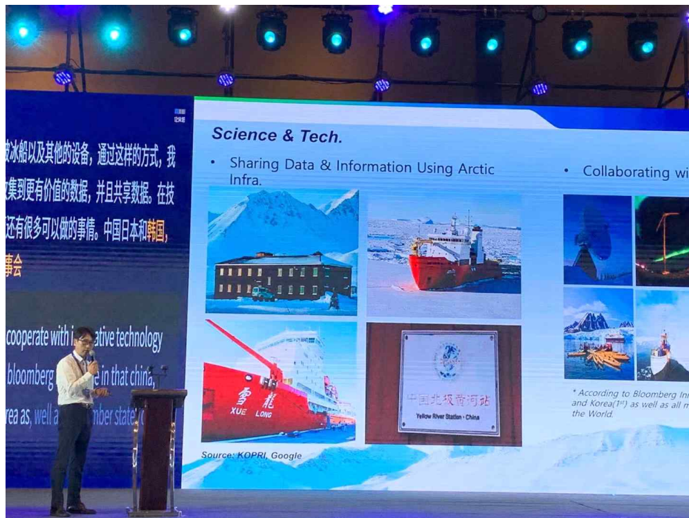
발표자 : KMI 극지연구센터 김민수 센터장