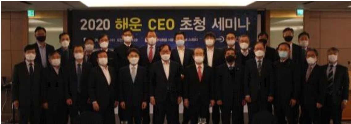
<붙임1> '2020 해운 CEO 초청 세미나' 사진