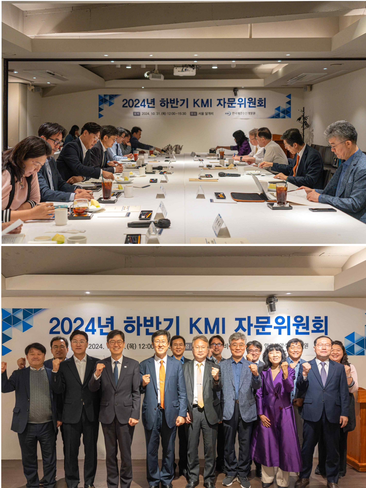
<붙임1> '2024년 하반기 KMI 자문위원회' 사진