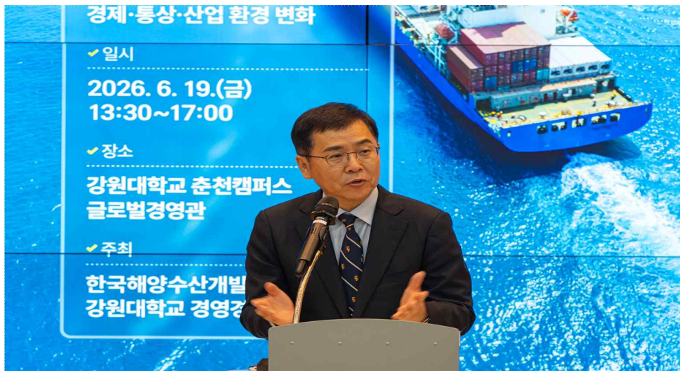
<붙임1> 한국해양수산개발원-강원대학교 경영경제연구소 공동 학술대회 사진