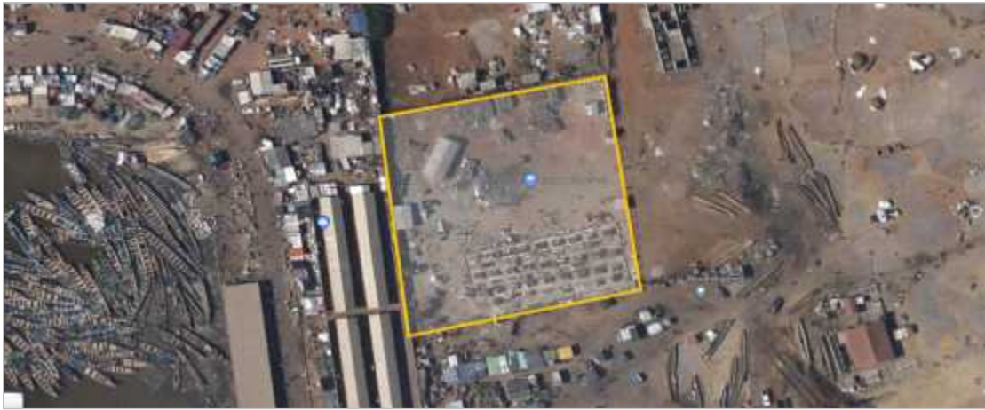
가나 테마항 부근 일원