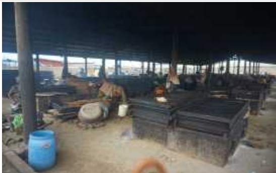
낙후된 훈연시설 및 각종 기자재