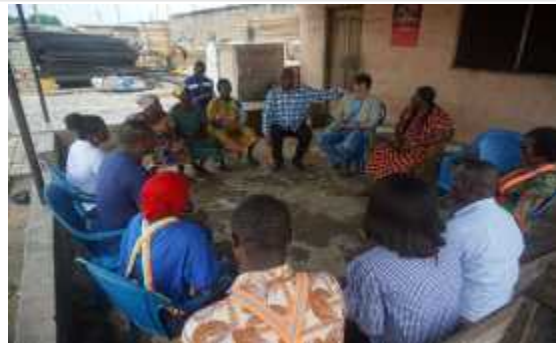
테마항 여성어업인협회 간담회