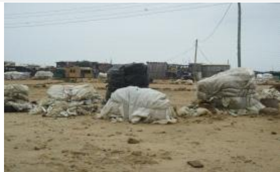
현재 가공수산물 저장방식