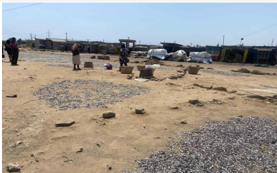
현재 어류 건조방식(흙바닥 위 건조)