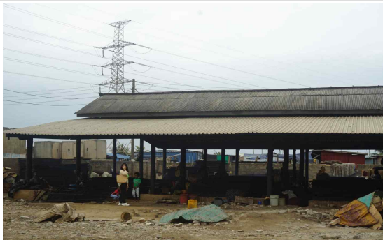
낮은 지반으로 침수가 잦은 가공시설