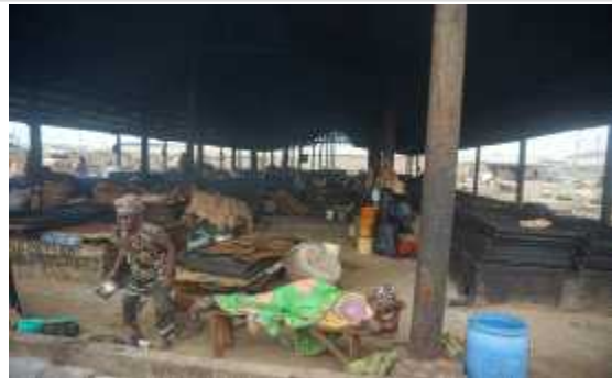
시설 내 생활하는 여성어업인과 아이들