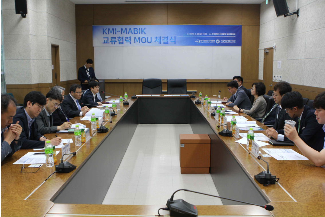
기관 간 연구교류 협력 방안 논의