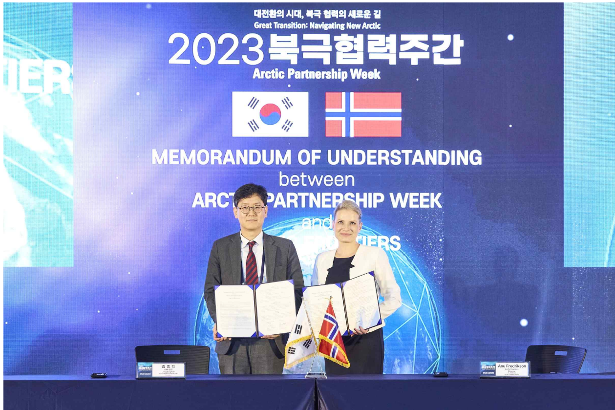
KMI-북극프론티어 사무국 MOU