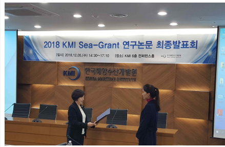
2018 KMI Sea-Grant 우수논문상 수여식