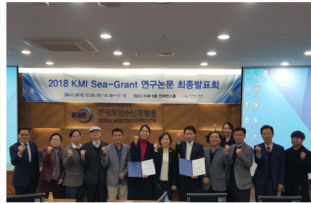
발표자 · 심사위원 단체 사진