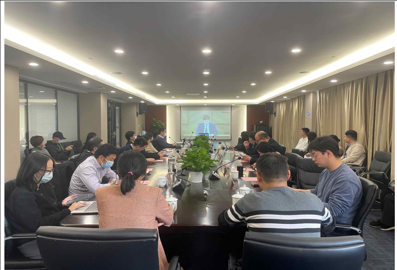
<붙임> 2021년 제12회 「KMI-SISI 국제해운포럼」 사진