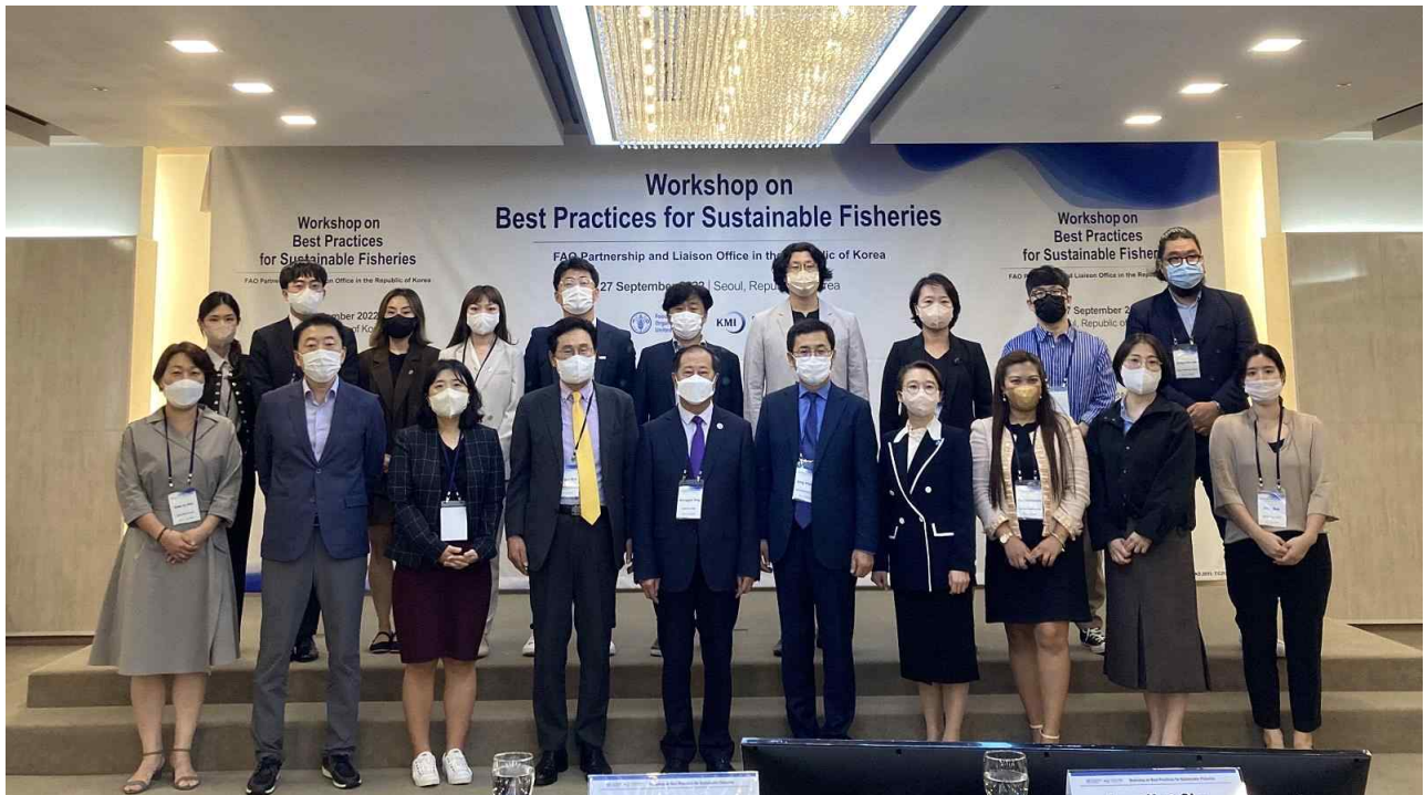
<붙임> FAO-KMI '지속가능한 수산업의 모범 사례에 관한 워크숍' 사진