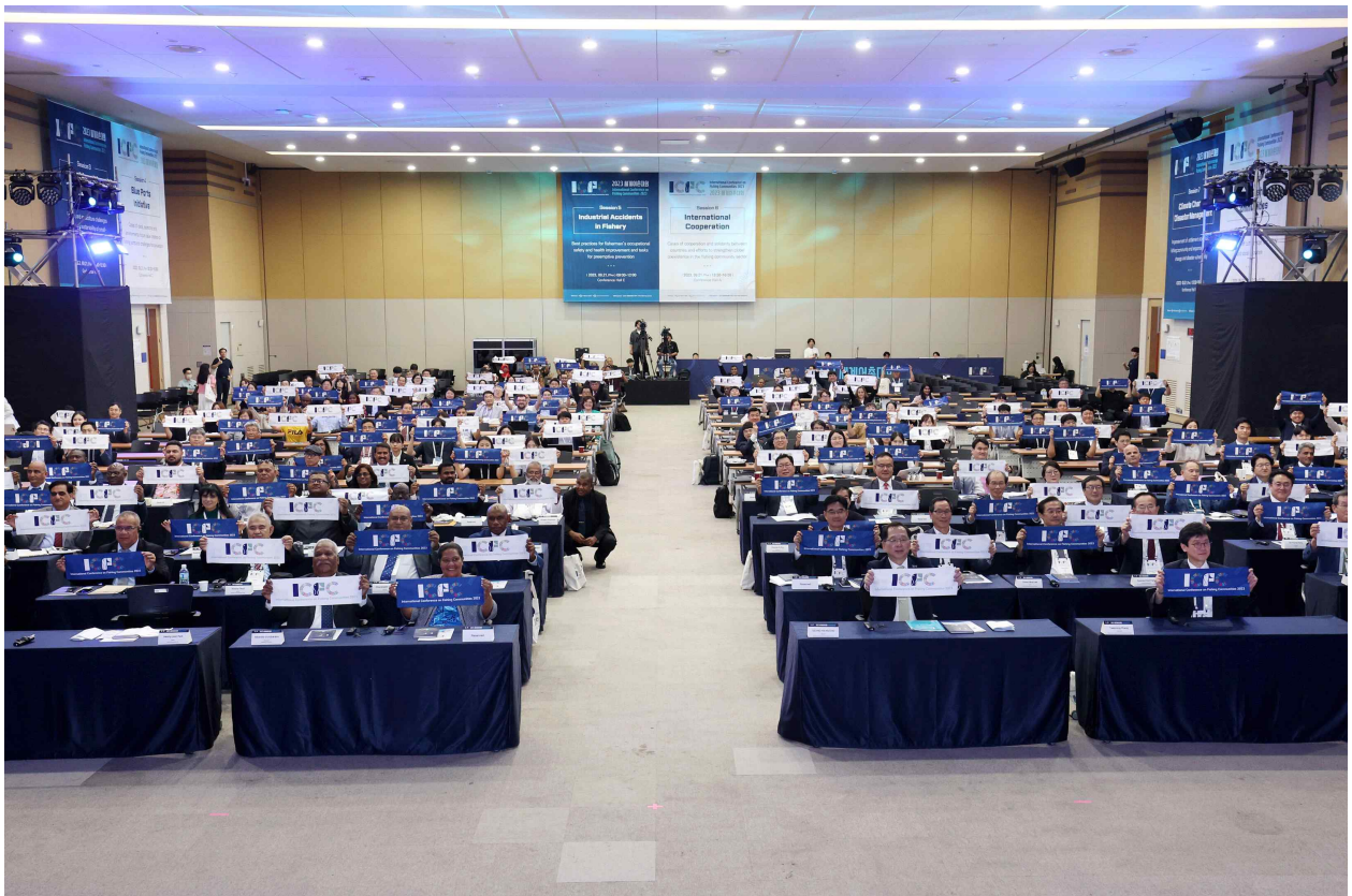
사진4(9.20 개막행사 ICFC 참석자 전원 촬영)