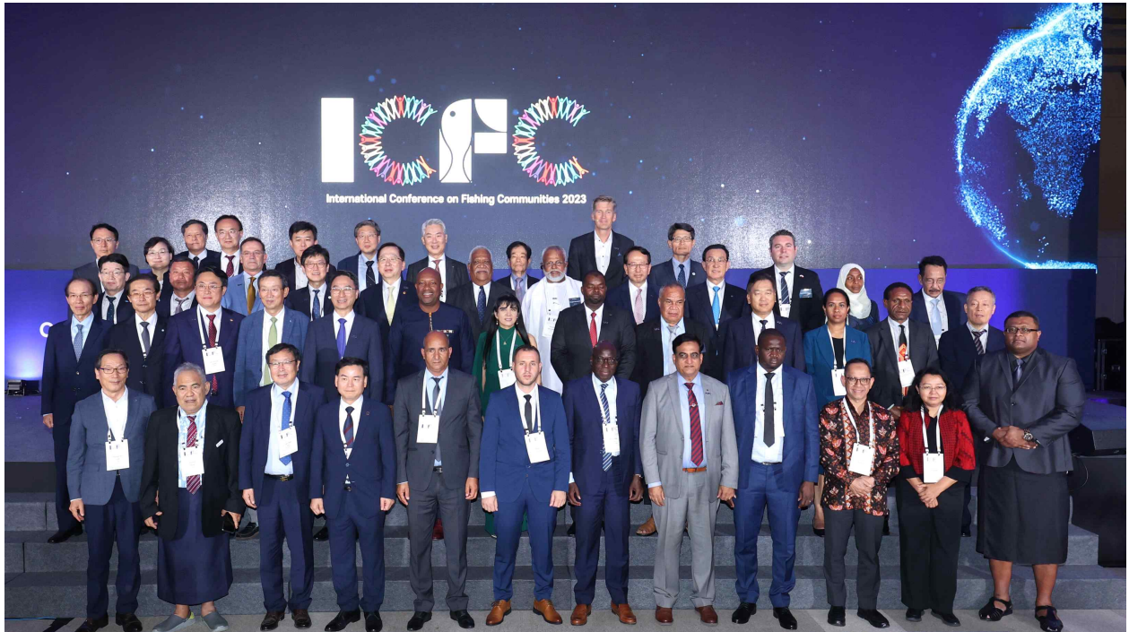
사진3(9.20 개막행사 기념 촬영)