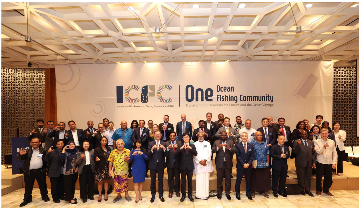
사진1(9.19 환영리셉션 기념 촬영)