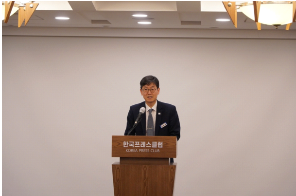
사진 자료(파일 별도 송부)