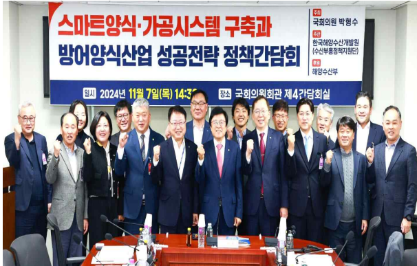
사진 자료(파일 별도 송부)