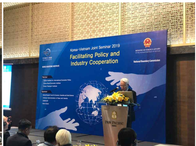
축사: 베트남 외교부 팜 싸오 마이 차관보