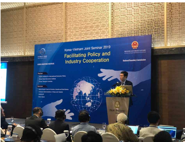
축사: 성경룡 경제·인문사회연구회 이사장