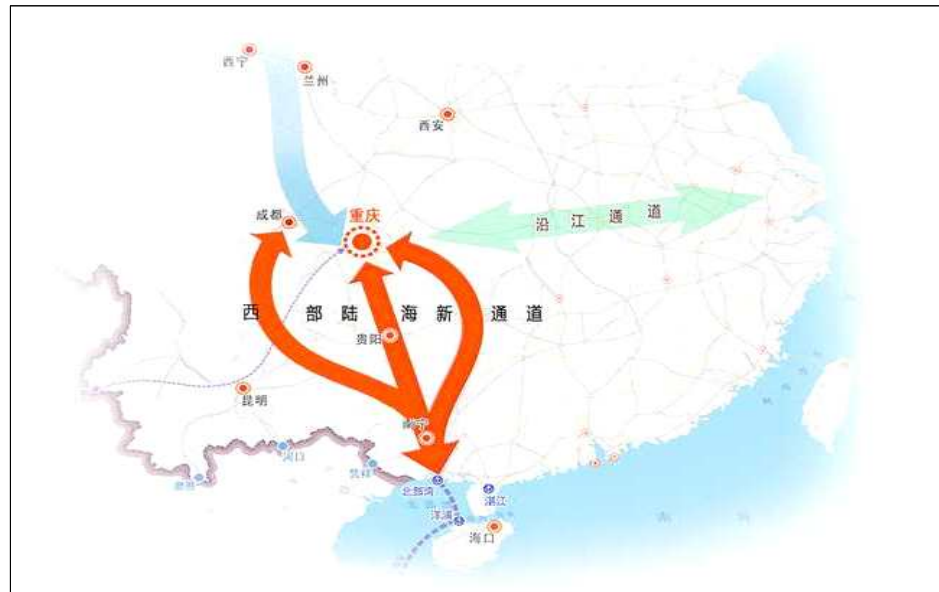
[ 서부육해신통로 공간 설명도 ]