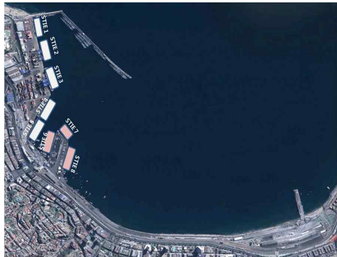
&lt;San Antonio와 Valparaiso 물동량 비교&gt;