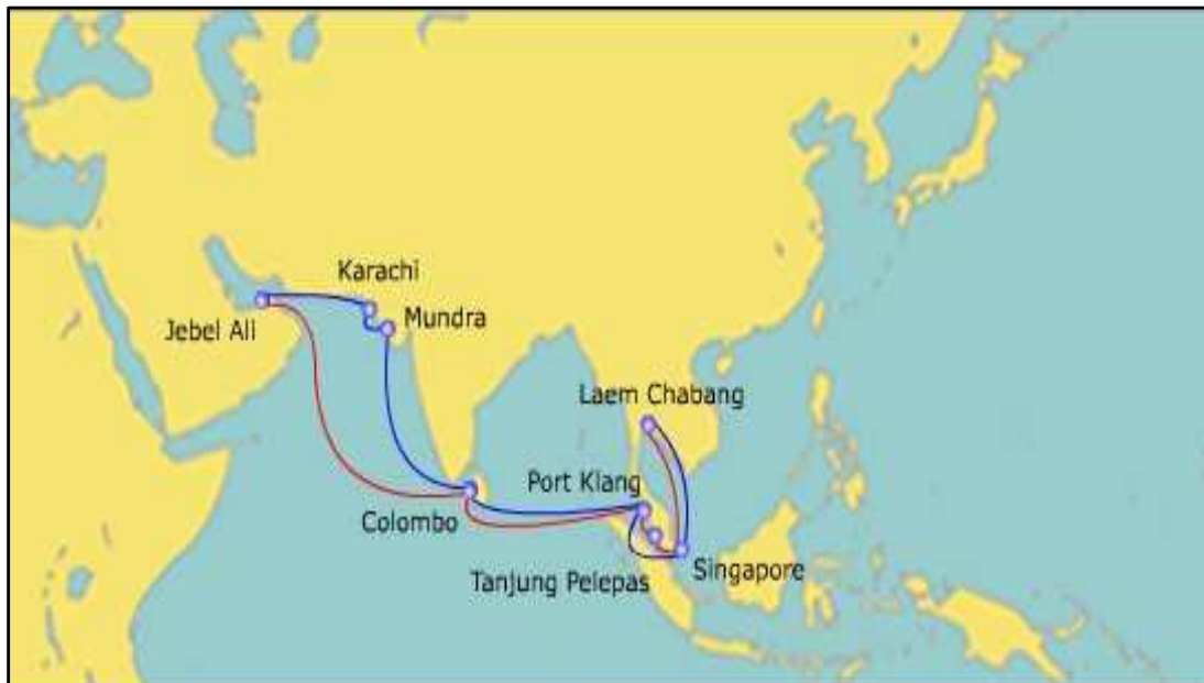
<ASEAN-Gulf-ISC (AGI) Network>