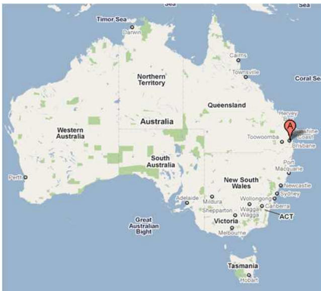
<호주 브리즈번항 위치>