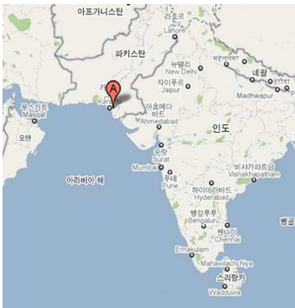
&lt;Port Qasim 위치&gt;