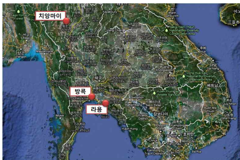
&lt;태국 투자 지역 위치도&gt;