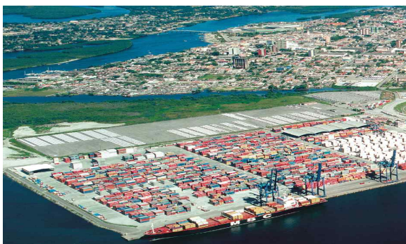
< TCB 전경 >