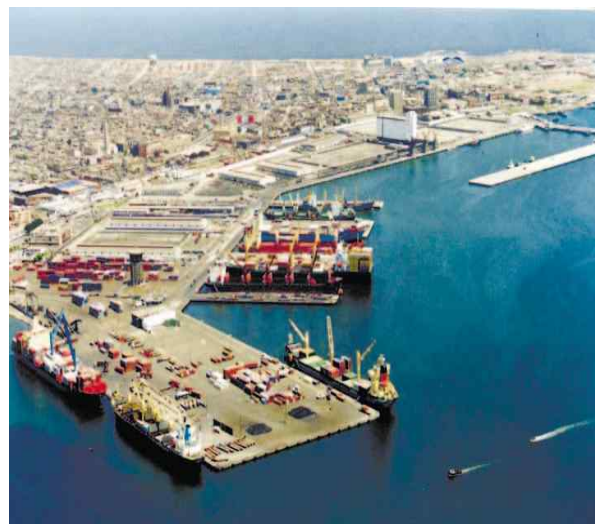
< Muelle Norte 터미널 전경 >

전혜경 연구원 (☎ 02-2105-2982, saei@kmi.re.kr)