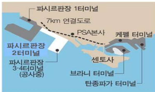
< 파시르판장 터미널 3·4단계 위치 >