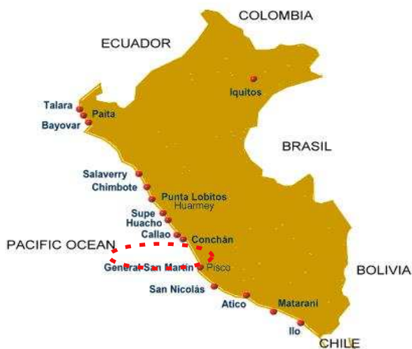
< Callao 항만 위치 >