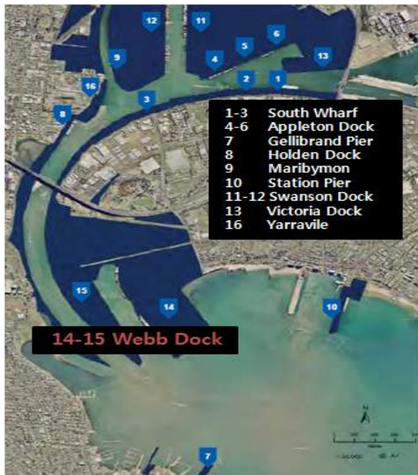
< 멜버른항 주요 시설 현황 >