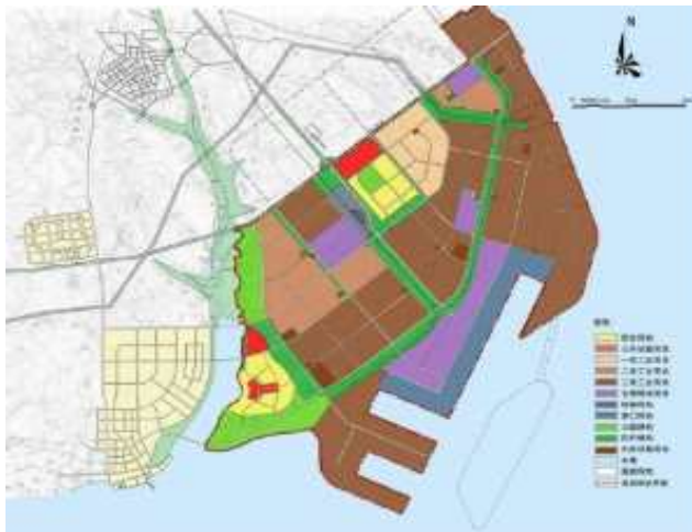
< 티에산항 개발 레이아웃 >