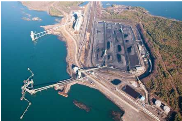
< 리들리 터미널 전경 >