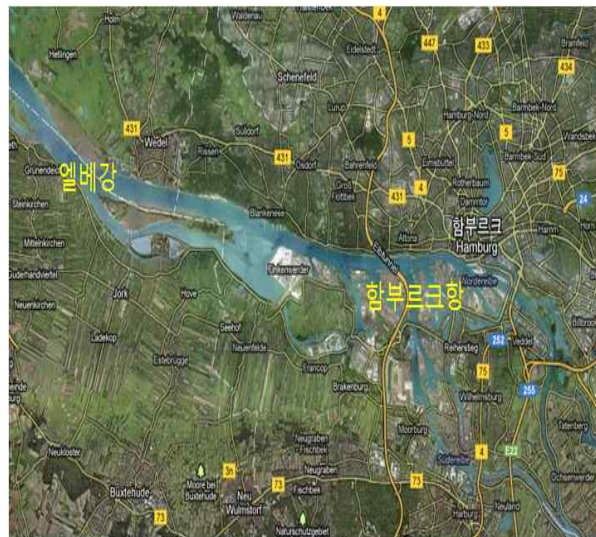
< 엘베강과 함부르크항 >