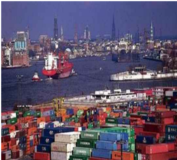
< 함부르크항 전경 >