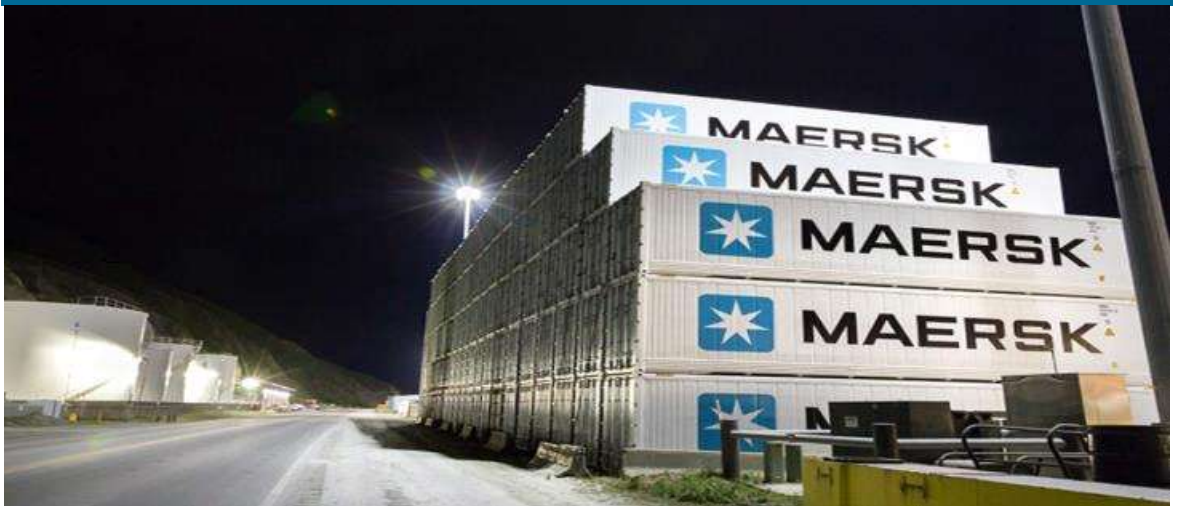
머스크의 냉동·냉장 컨테이너 야적 현황