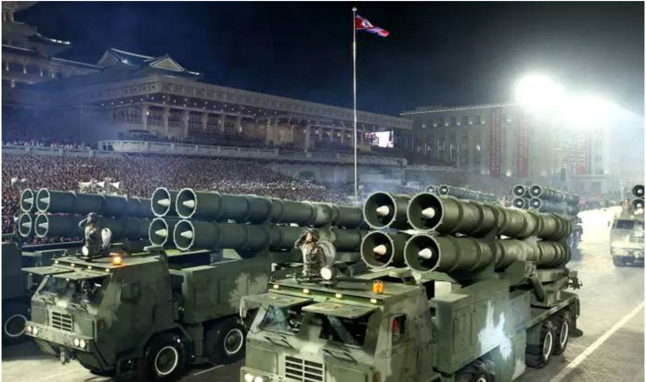
그림. 2022년 4월 25일 평양에서 열린 열병식에서의 북한의 로켓 발사대 차량