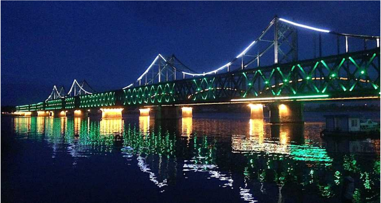
그림. 중국 단둥과 북한 신의주를 연결하는 우정의 다리