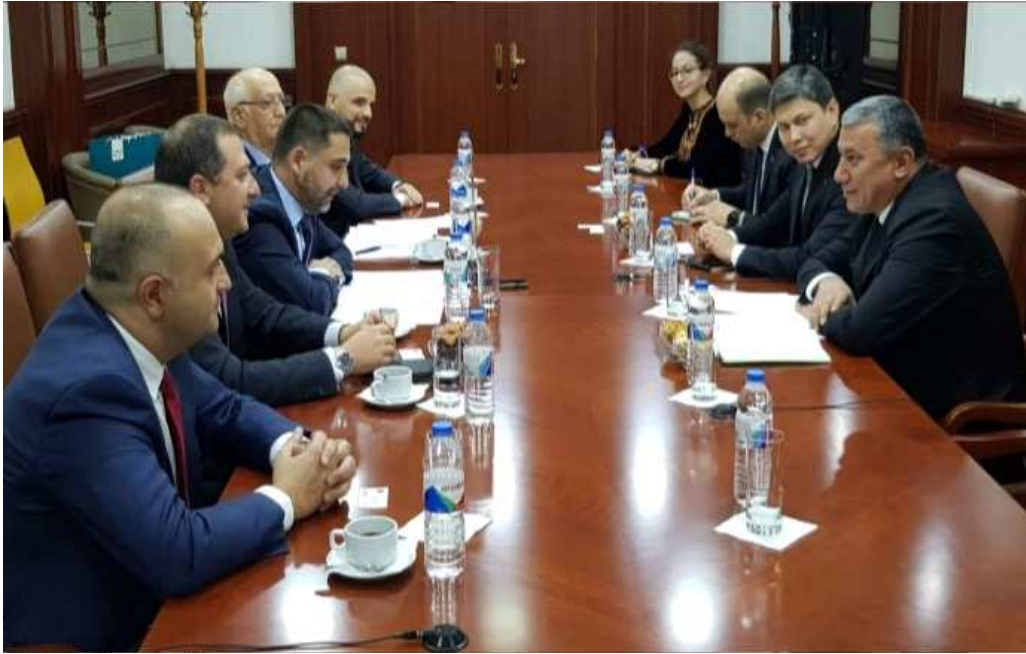
그림. 조지아-투르크메니스탄 석유가스 실무진 회담