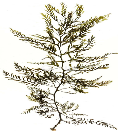
그림 1. 갯쟁이모자반