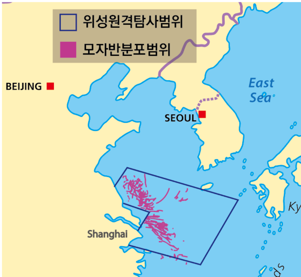
그림 4. 중국 위성원격탐사를 통한 모자반 모니터링 영상