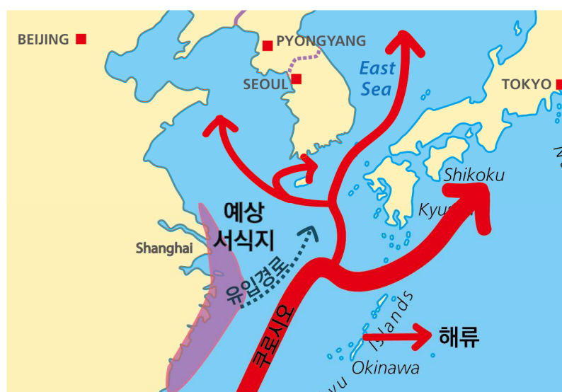
그림 2. 갯쟁이모자반 유입경로