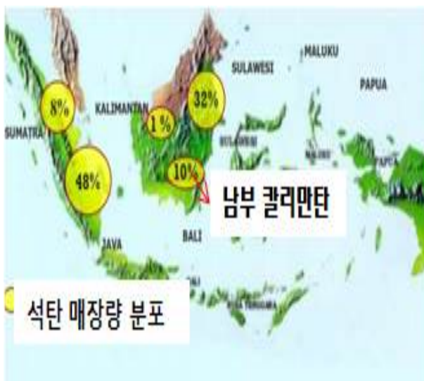
&lt; South Kalimantan 위치 &gt;