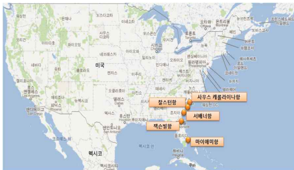
< 미국 동부 주요항 위치 >