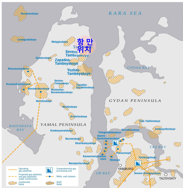
< Sabetta 항만 위치 >