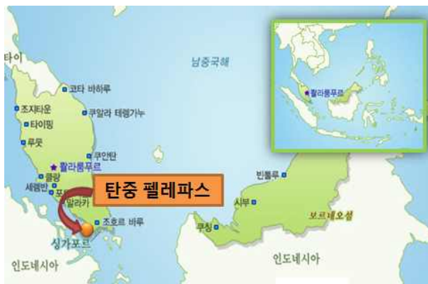
< 탄중 펠레파스항 위치 >