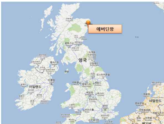
< 애버딘항 위치 >