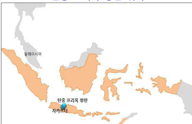
&lt; 탄중 프리옥 항만 위치 &gt;