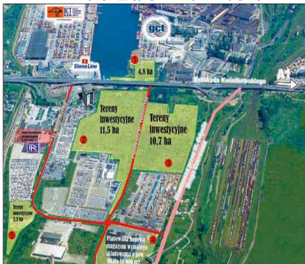
&lt; 그드니아 물류창고 개발 대상지 &gt;