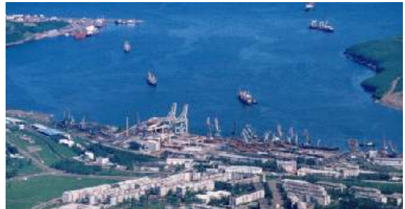
&lt; Vanino항 &gt;