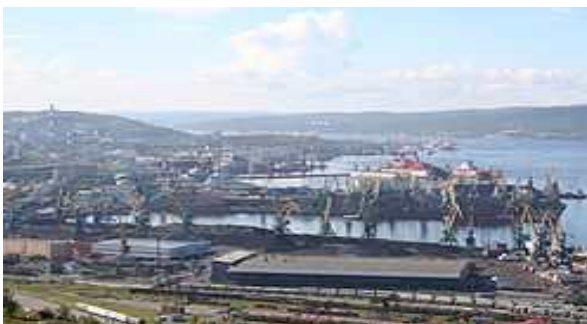
&lt; Murmansk항 &gt;