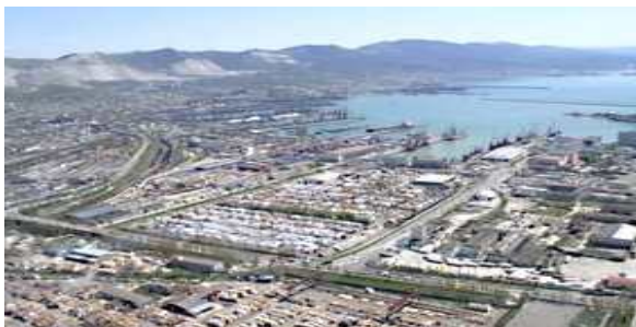
&lt; Novorossiysk항 &gt;