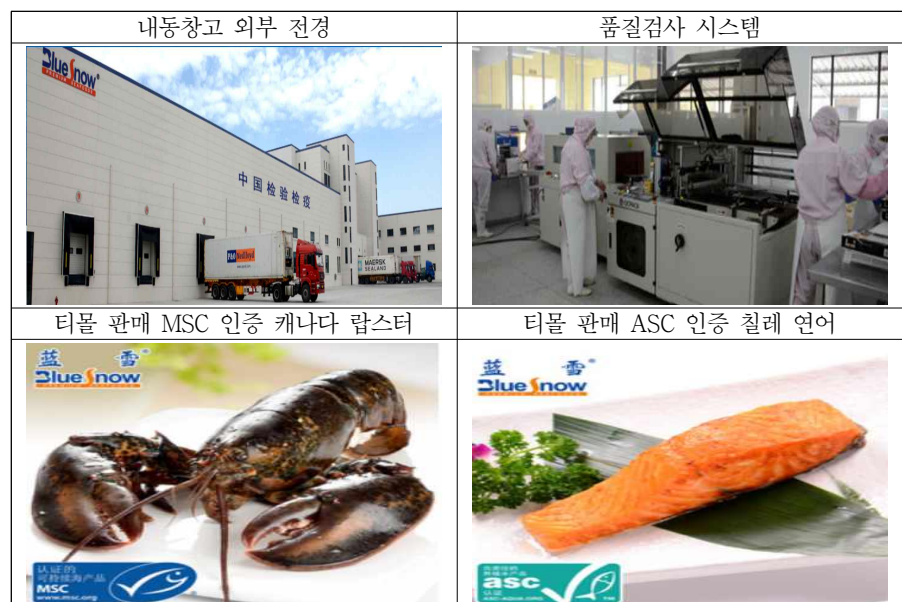
[그림 4] 저장 Blue Snow식품회사 창고 및 온라인 매장