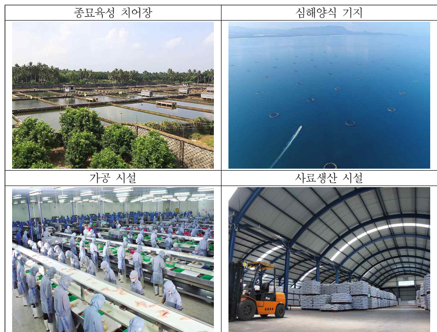
[그림 6] 하이난 상타이어업주식회사의 주요 사업 영역