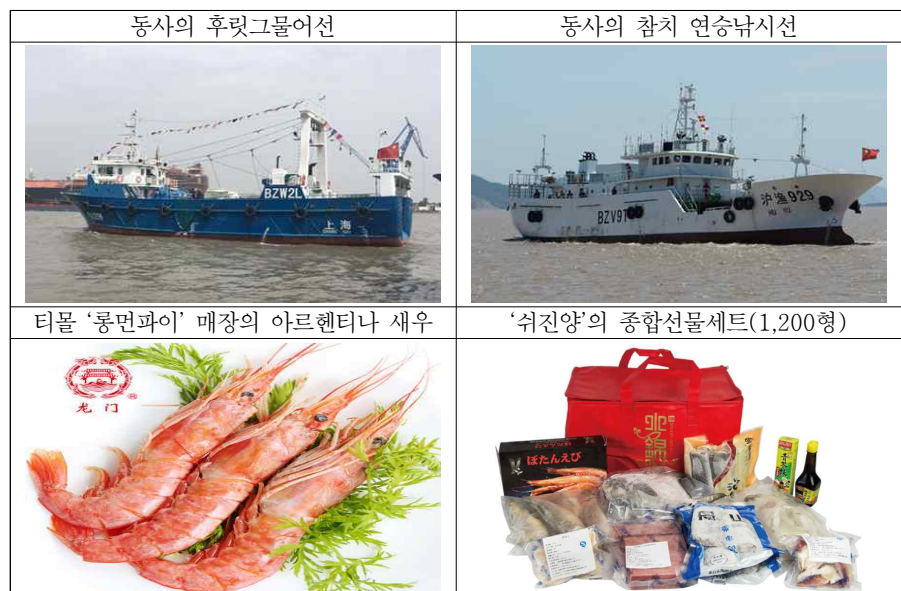
[그림 3] 상하이 수산그룹 선대 및 제품

자료: 상하이 수산그룹( http://www.sfgc.com.cn ) 및 티몰 룽먼파이 매장( https://longmensp.tmall.com ), 쉬진양( http://www.sjyocan.com ) 홈페이지