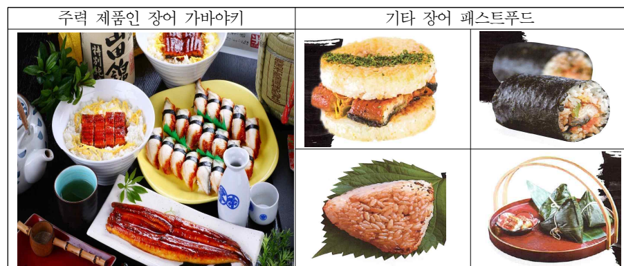
[그림 7] 만위황호우(QUEEN EEL)의 다양한 장어 제품들