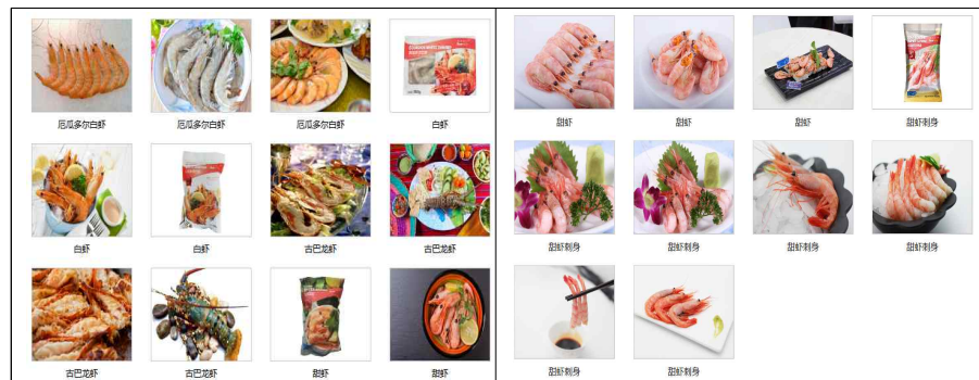
[그림 5] 칭다오 베이양자메이수산회사의 다양한 새우류 제품들