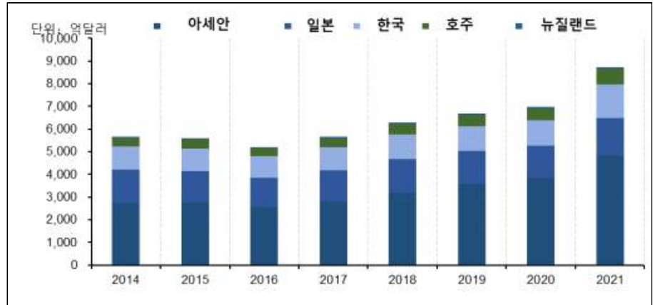
[그림 1] 중국의 對 RCEP 회원국 수출액 변화 추이(2014~2021)

무부 연구소가 발간한 “RCEP가 지역 경제에 미치는 영향 평가 보고서”는 RCEP로 인해 2035년까지 역내 국가의 GDP, 수출 및 수입이 각각 추가로 0.86%, 18.30%와 9.63% 증가할 것이라 전망했다. 또한, 아세안 전체 GDP 누적 성장률은 RCEP로 인해 4.47% 추가로 증가할 것이며, 이중 한국의 수출 누적 증가폭과 중국의 수입 누적 증가폭이 가장 클 것이라고 전망했다.([그림 1])