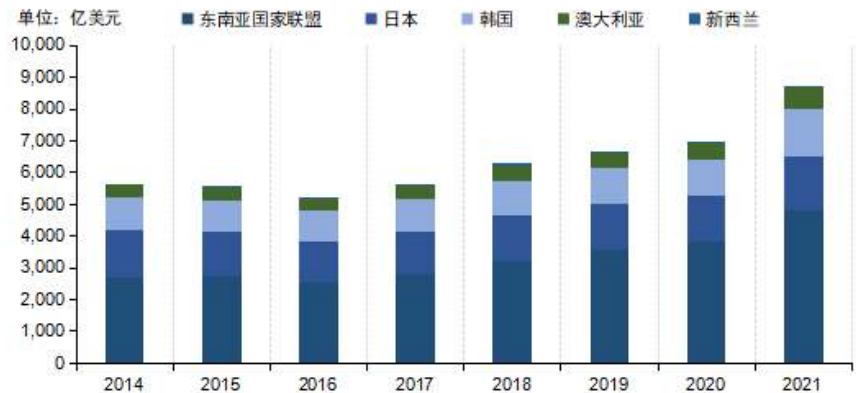
图1 2014年—2021年中国对RCEP 成员国的出口贸易额情况

当前RCEP区域内贸易比较活跃，RCEP区域贸易已经成为主要成员国最重要的贸易伙伴。以中国为例，RCEP区域内贸易已经占到其对外贸易量42%，且近年来与东南亚、日本、韩国等双边贸易都保持较好增长态势。据中国商务部研究院发布《RCEP对区域经济影响评估报告》显示，到2035年，RCEP将带动区域整体的实际国内生产总值（GDP）、出口和进口增量分别较基准情形累计增长0.86%、18.30%和9.63%。预计东盟整体GDP累计增长率将因RCEP增加4.47%，韩国的出口累计增幅最大，而中国的进口累计增幅最大。