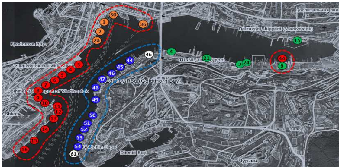
[그림 1] 블라디보스토크항

주 : 빨간색 점선-상업항(러시아 항만청 기준), 파란색 점선-어항(러시아 항만청 기준), 빨간색 번호-OAO «Владивостокский морской торговый порт», 파란번호-OAO «Владивостокский морской рыбный порт», 주황색 번호-상업항 선석, 흰색 번호-어항 선석