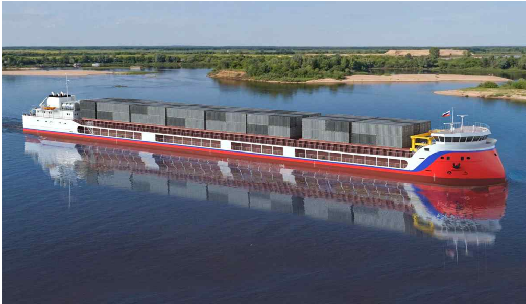
그림. 건조 예정 선박