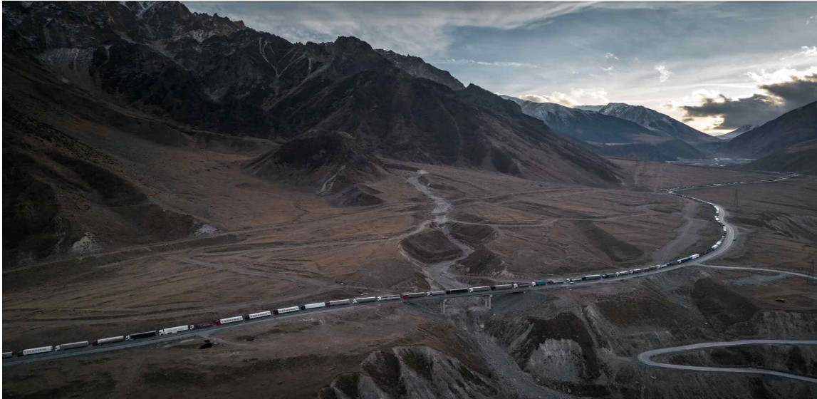
그림. 그루지야~러시아 국경에서 대기 중인 화물 트럭의 행렬(2023년 1월 11일)