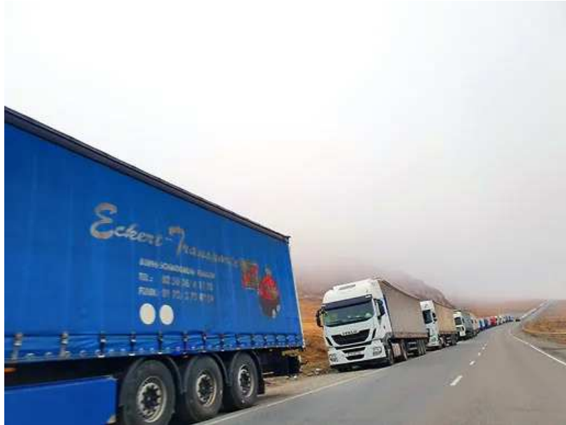
그림. 조지아러시아 국경에서 대기 중인 트럭