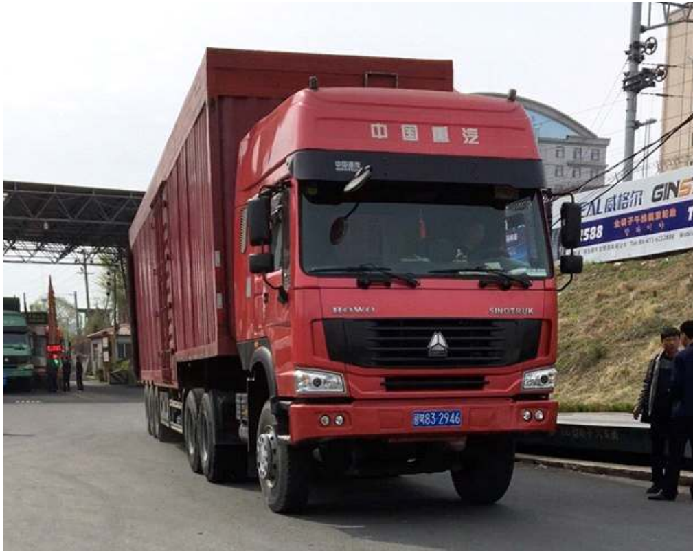
그림. 중국 단둥 세관을 통과하는 화물 트럭