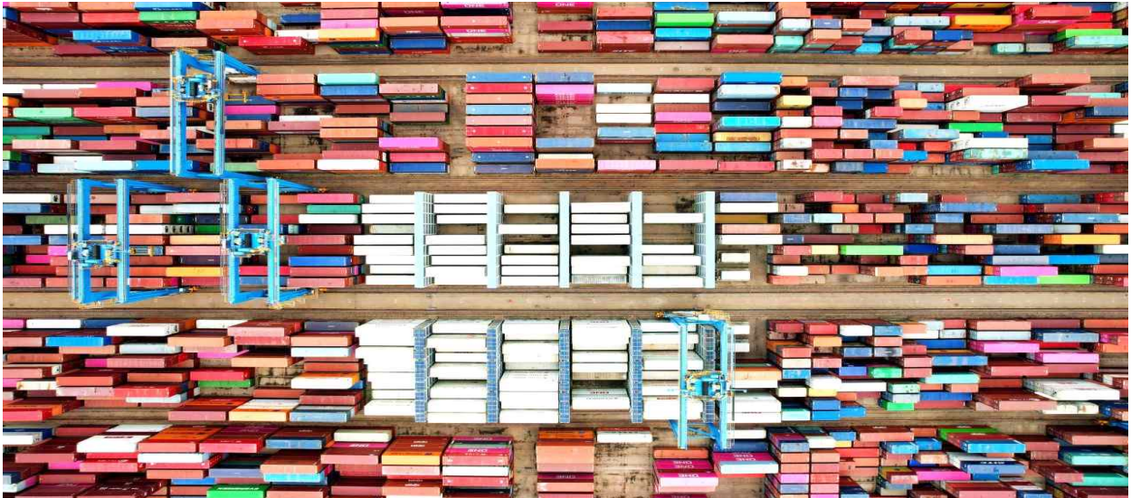
그림. 2022년 6월 9일 중국 동부 산둥(山東)성 칭다오(靑島) 항만 적체 화물