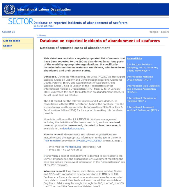
〈그림 1〉 선원 유기 사건 보고를 위한 데이터베이스(좌) 및 선원 유기에 관한 IMO/ILO 가이드라인(우) b),c)