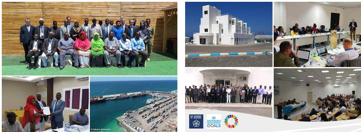
〈그림 2〉 IMO의 해상보안 강화 워크숍 사진

자료 : http://www.imo.org/en/MediaCentre/WhatsNew/Pages/default.aspx (검색일: 2019.03.19.)