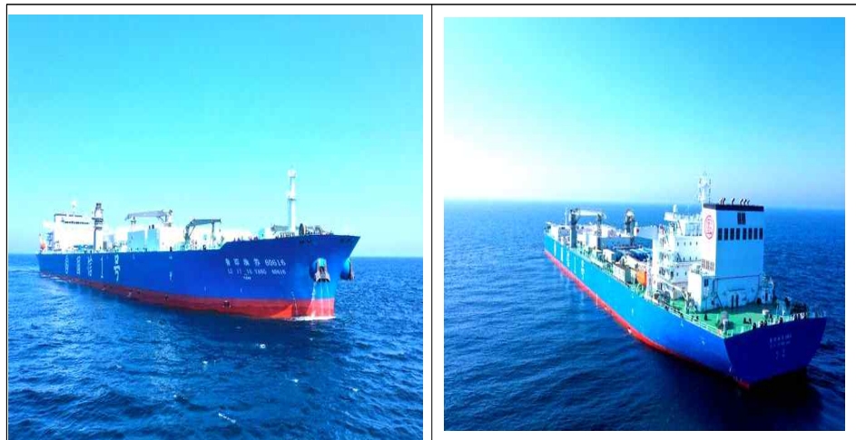
[그림 1] 스마트 양식 작업선 '귀신1호'