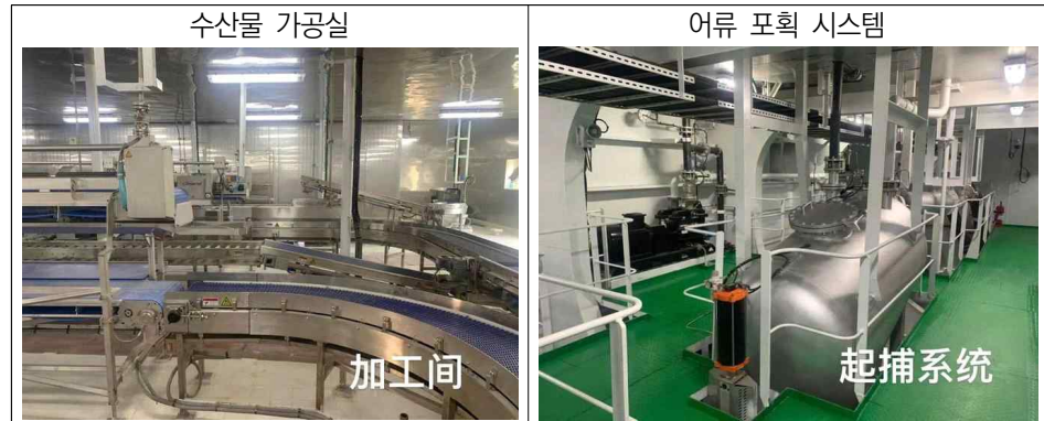
[그림 3] '귀신1호' 내부 시설(2)