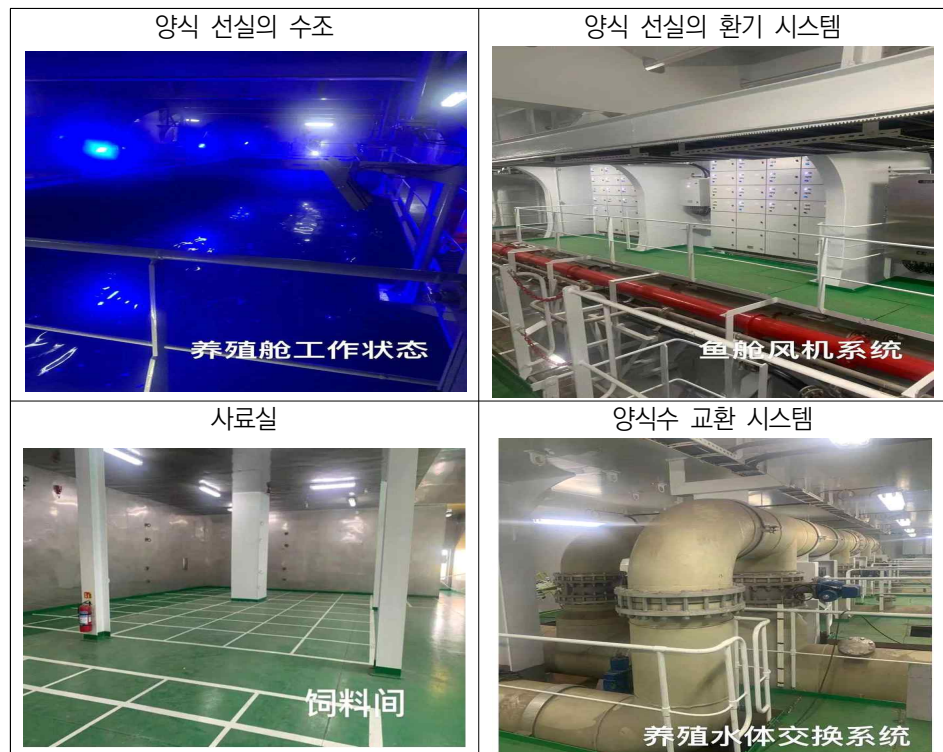
[그림 2] '귀신1호'의 내부 시설(1)